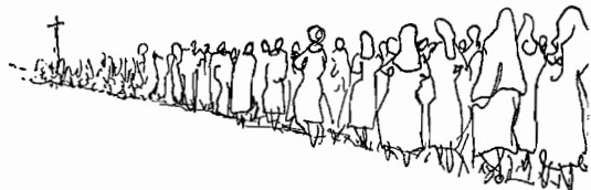
(Dessin de Dragutescu)

Ils haïssent l'Occident, car ils sentent qu'ils lui sont inférieurs. Bien qu'eux-mêmes non communistes il leur plaît de s'associer avec Moscou, car Moscou, elle aussi, cherche à abattre l'Occident.