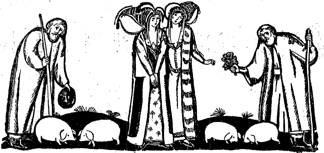
Desemn de Demian

La mulți ani, din tot sufletul la mulți ani, părinte Bonaventura! Dumnezeu să ne facă parte încă pentru mulți ani de cuvântul Domniei-tale, atât de edificant și de convingător, de marea dragoste și de căldura umană pe care le iradiază sufletul Dumitale, de exemplul luminos al vieții Dumitale total închinată lui Dumnezeu, zidită în iubirea Lui.