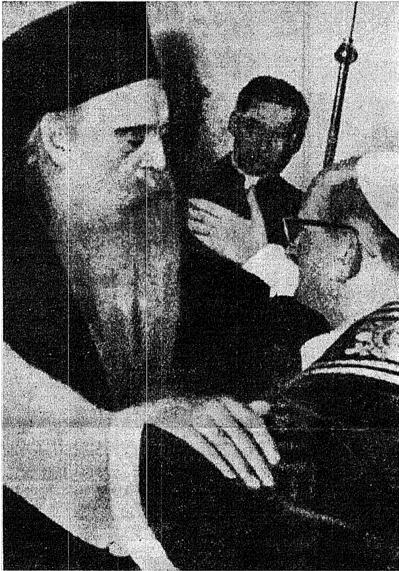
Îmbrăţişarea celor doi fraţi despărţiţi

Ceeace noi trebuie să începem să dezvoltăm încă de acum e aceea frăţească dragoste, atât de ingenioasă în a descoperi noi posibilităţi de a se manifesta, care, ţinând seamă de