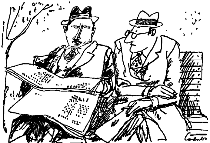
“Foreigners think life is all black here.” “Why?” “Because they see our documentaries.”

The division of Europe, created and forcibly maintained by the Soviet Union, is one of the prime causes of world tensions. Various plans are under discussion to bring Europe back to normal conditions. The restoration of human rights to the peoples of captive East-Central Europe is one of the prerequisites for such conditions.