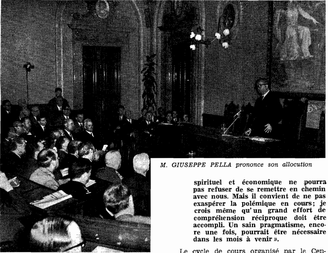
M. GIUSEPPE PELLA prononce son allocution

continué M. Pella — notre économie et l'économie communautaire ont tiré des avantages inestimables. On doit au vigoureux processus de libéralisation dont l'Italie a été l'un des éléments de pointe, le fait que bien des secteurs de notre économie ont dû se moderniser et se nationaliser... Le Marché Commun dans ses finalités immédiates d'ordre économique et social et dans ses objectifs plus éloignés de nature politique, a provoqué ce bond en avant qui a permis de prodigieux résultats dans la dilatation du revenu national des divers Pays et pour la Communauté à Six ».