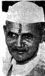
Lal Bahadur Shastri

Yalta n'a été qu'un acte de piraterie politique. Et ce fut le premier et le plus grave attentat à l'unité de l'Europe et donc à l'équilibre mondial.