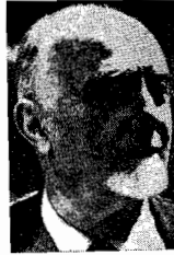
COMTE CARLO SFORZA (1872 - 1952)