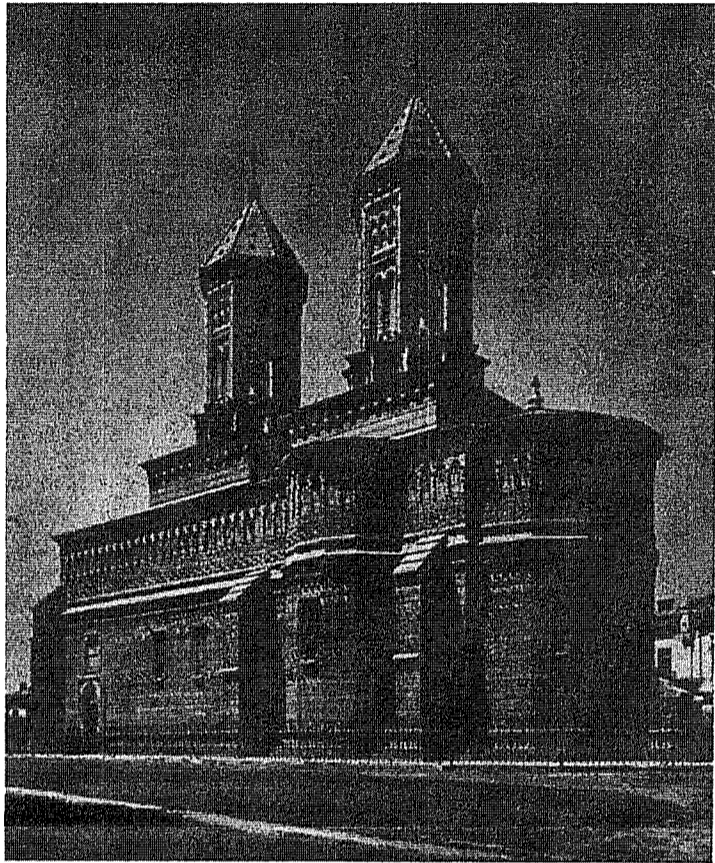
Biserica Trei Ierarhi (Iasi)

acest schimb de muștrări și de proteste, dacă n'ar fi intervenit, aruncând cum se spune «gaz peste foc» unele organizații catolice aservite regimului, creiază greutăți aceluia care se află în condiția de a trebui să se socotească zi de zi cu o altă realitate.