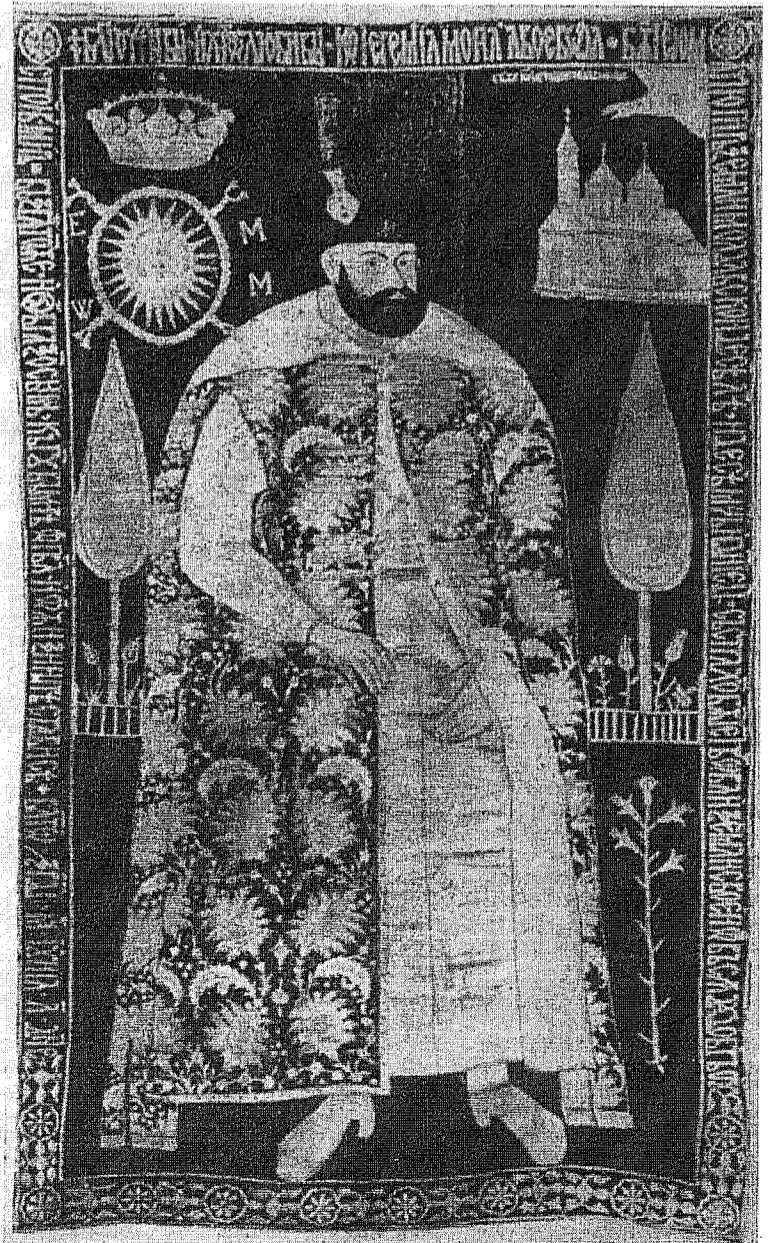
Broderie din veacul al 18-lea în matase albastră, aur și argint pe mormantul lui Jeremia Movila