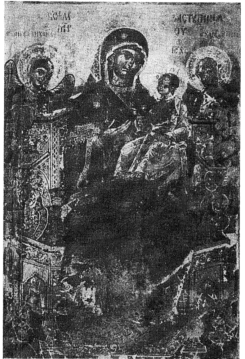
Fecioara Maria și Isus: Pictura romanească dela începutul veacului 18-lea

Sarcina principală a acestui seminar e aceea de a forma un cler european pentru necesitățile spirituale ale Europei.