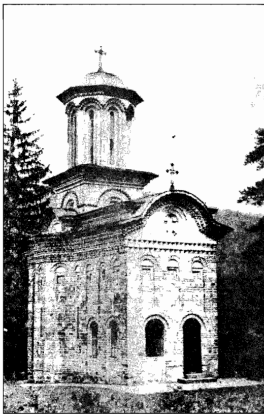
Bolnița mănăstirii Cozia (1542)

Natură și istorie, liniște și sănătate, oameni minunați, dar mai ales file de istorie traco-daco-românească, iată ce se află în această parte a României. Este un itinerariu național unic, care trebuie negreșit vizitat.