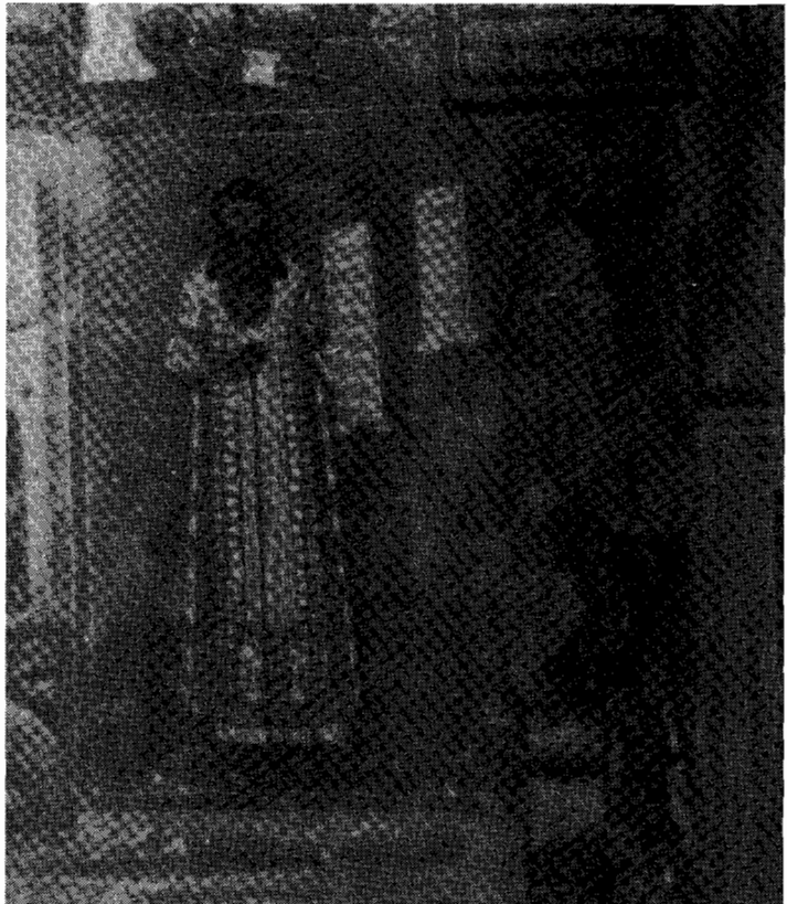
Frescă de la Mănăstirea Voroneț reprezentând pe mitropolitul Grigore Roșca și pe Daniil Sisastrul (cu aureolă).

Se știe că în această perioadă în rândurile armatei turcești a izbucnit flagelul ciumei, element principal în a schimba raportul de forțe și hotărâtor în retragerea armatei turcești. Dacă Daniil Sisastrul (chiar dacă nu a utilizat microbul) a prevăzut apariția epidemiei, putem să-l considerăm ca pe un precursor al ideii de susținere a unui război cu forțe puține împotriva unei armate numeroase, utilizând efectele naturale sau micro-biologice. În bătălia de la Baia, Ștefan cel Mare a reușit să învingă pe Matei Corvin printr-o luptă pe timp de noapte, la lumina flăcărilor cetății incendiate. Prin analogie, este posibil ca și în această bătălie să se întrevadă ingeniozitatea lui Daniil Sisastrul.