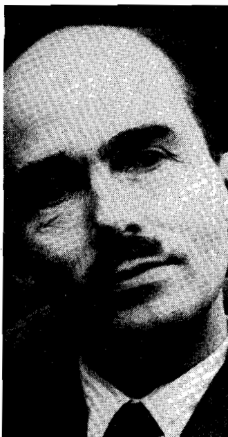
Otto de Habsbourg

En attendant, on a pu juger la signification véritable