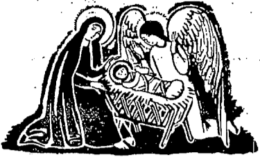
Desen de Demian

În viața Românilor americani, sediul actualei reședințe episcopale ortodoxe reprezintă o prelungire a țării lăsată acasă. Este interesant pentru cei ce nu știu, să reproducem câteva date extrase din Albumul Aniversar publicat în 1954 de către Episcopia Ortodoxă Română din America.