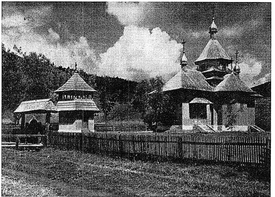
Biserica de lemn în Cărlibaba

Nu se întample, venerabili frați, ca fiii Bisericii catolice, pentru simplul fapt că datorită unui dar gratuit al divinei Providențe sunt în posesia adevărului deplin, să se arate mai puțin zeloși față de o cauză atât de sublimă, atât de sfântă. Ei trebuie, dimpotrivă, să fie însufleșiți de o sfântă emulație cu frații lor necatolici, care să-i facă cu atât mai generoși în ce privește rugăciunea și penitența, cu cât Dumnezeu le-a dat darul neprețuit al apartinerii la Biserica Sa. Subt cărmuirea sfinților păstori, care în timpul Conciliului au dovedit cât le e de scumpă cauza unirii, rugăciunea credincioșilor să devie mai fierbinte decât în trecut, pentru a cere de la Dumnezeu realizarea unității creștinilor prin mijlocirea și harul sfântului sau Spirit ».