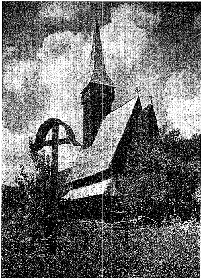
Biserica de lemn in Transilvania

Cele încă lungă, e sigur, și presărată de obstacole care nu pot fi eliminate în câteva ceasuri, de prejudecăți și de interpretări greșite acumulate în cursul veacurilor. Dar a fi pe drumul cel bun, a fi reluat un contact personal, după veacuri de despărțire, nu e oare anunț și presimțirea unor evoluții care, cu ajutorul lui Dumnezeu, ar putea duce într'o bună zi la unirea dorită? »