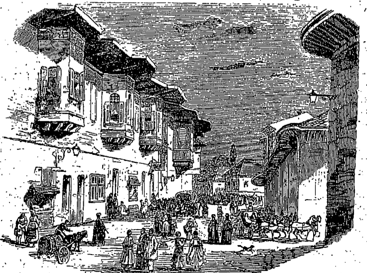
Bucureștii de altădată

Si dacă ne gândim bine, în ultimă analiză e o ofensă pentru frații despărțiți să li se atribue o dispoziție la compromisuri și cedări pentru a se duce la bun sfârșit un dialog care,