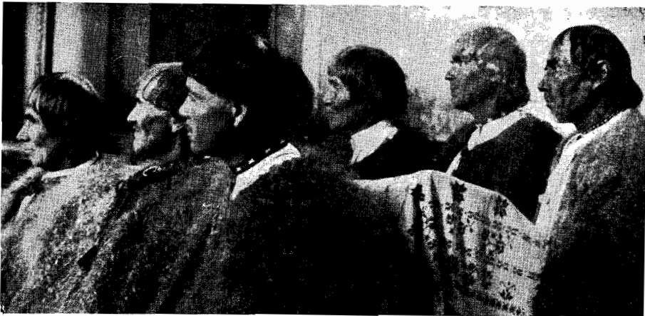
Paysans roumains de Transylvanie, d'après une photo récente: le fait curieux est que ces profils ressemblent à ceux des personnages de la colonne Trajane, les ancêtres des Roumains modernes, après les guerres victorieuses de Trajan et la création de la Dacie

La sagesse de Lacordaire est encore actuelle: « Entre le riche et le pauvre, entre le faible et le fort, c'est la liberté qui opprime, c'est la loi qui affranchit. »