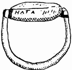
Inelul de la Ezerovo

ΡΟΛΙΣΤΕΝΕΑΣ Ν ΕΡΕΝΕΑΤΙΑ ΤΕ ΑΝΗΣΚΟΑ ΡΑΙΕΑΔΟΜ ΕΑΝΤΙΛΕΙΒ ΠΤΑΜΙΗΕ ΡΑΙ ΗΑΤΑ