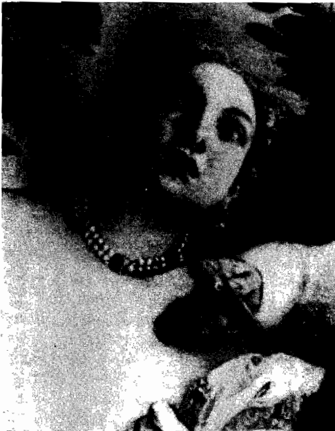
L'enlèvement d'Europe. Europe, fille de Phoenix et de Périclès ou de Cassiopée ou de Téléphassa ou de Téléphe, ou bien d'Agénor et de Téléphassa ou de Téléphe ou d'Argyope.