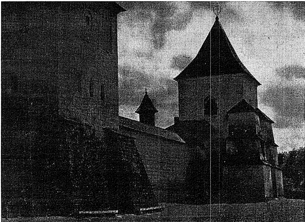
Zidurile Mănăstirii Sucevița

« Această neutralitate — a spus Papa — nu trebuie înțeleasă în sens strict pasiv, ca și când menirea Papei s'ar limita la observarea evenimentelor și la a tăcea asupra acestor evenimente. Este, dimpotrivă, o neutralitate care păstrează vigoarea unei prezențe active. Solicitată să apere principiile păcii adevărate, Biserica nu renunță la datoria sa de a încuraja adoptarea unui limbaj, a unor raporturi și instituții care să garanteze stabilitatea acestei păci. Am repetat lucrul acesta de nenumărate ori: acțiunea Bisericii nu este numai o acțiune negativă; ea nu consistă numai în a sconjura guvernele să evite recurgerea la puterea armată; este o acțiune care vrea să formeze oameni ale căror gânduri, ale căror suflete, ale căror mâini să fie pașnice ».