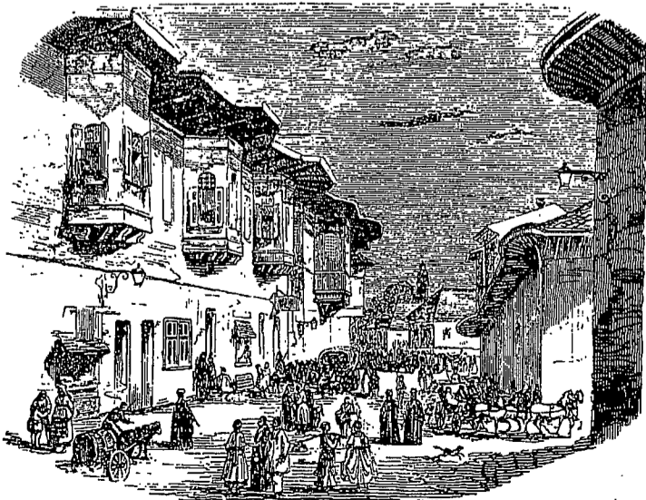
Bucureștii de altădată

Pe baza unei asemenea atitudini trebuie să se caute să se ajungă, puțin câte puțin, la unitate chiar și asupra punctelor unde unitatea încă nu există, adică în profesarea aceleiași credințe, în uzul aceluiași mijloace ale Grației divine, adică al Sfințelor Taine (aceasta pentru protestanți, a precizat cardinalul) și în sfârșit să se ajungă la o unitate de acțiune sub cărmuirea Păstorilor puși de Dumnezeu în fruntea Bisericii lui Dumnezeu.