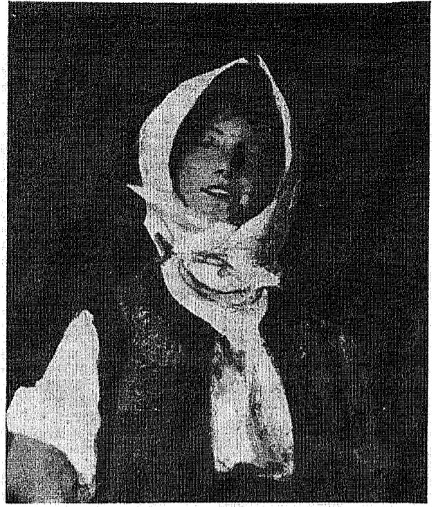
N. Grigorescu: Tărăncuta

« Noi sperăm în această minune care ar putea fi începutul convertirii Rusiei prezisă de Sfânta Fecioară Maria la Fatima. 1967 nu e oare anul semi-centenarului aparițiilor de la Fatima?... »