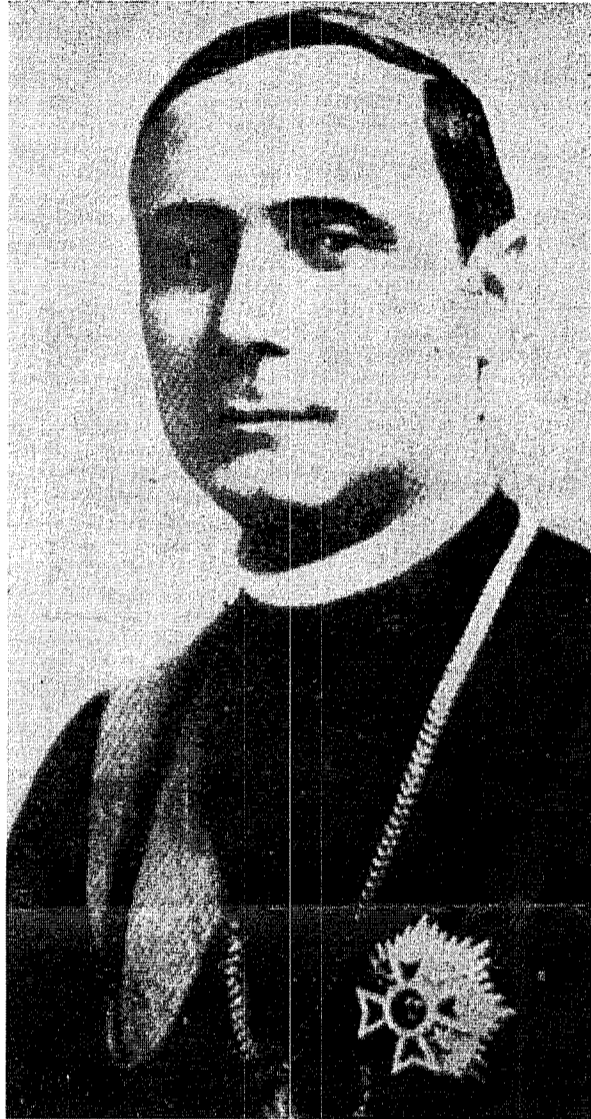
Înalt Prea Sfințitul Iuliu Hossu

Bătrânul cu ochii încrețați de lacrimile neplânse, va revedea apoi, cu țaria trăirilor prezente, păstoria sa în țara cea nouă, recunoscută însăfârșit ca a sa, unde biserica lui era acum cinstită după meritele înfăptuirilor sale trecute și după obolul adus la