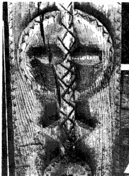
Chenar de poartă (Sculptură în lemn)

Omul dorește să pară altcum decât e în realitate. Chiar față de sine însuși și față de Dumnezeu. Si în felul acesta se îndepărtează de adevăr, de simplitate și natural de căință și de mântuire.