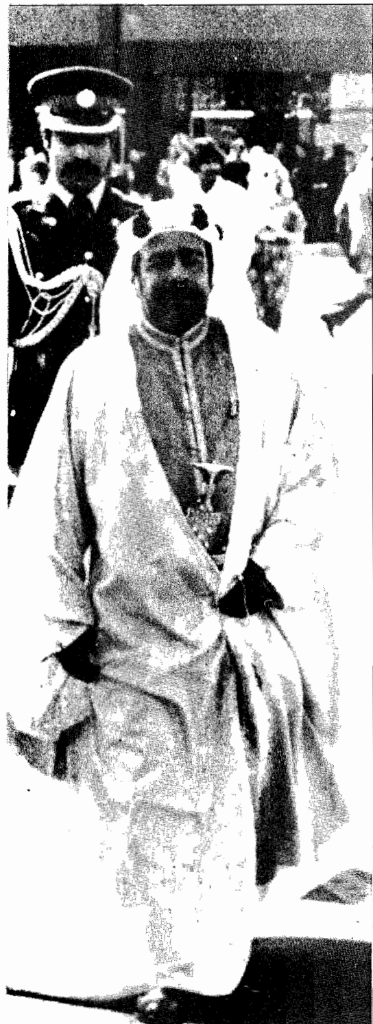
an al Khalifa, l'émire du Bahrein.

Les 75 mégatonnes de la France sont très utiles, mais pas à une France isolée et orgueilleuse, mais à une France consciente de la nécessité d'unir ses forces et ses ressources à celles de tous les pays du monde qui se défendent des agressions réelles et potentielles tramées par le Kremlin.