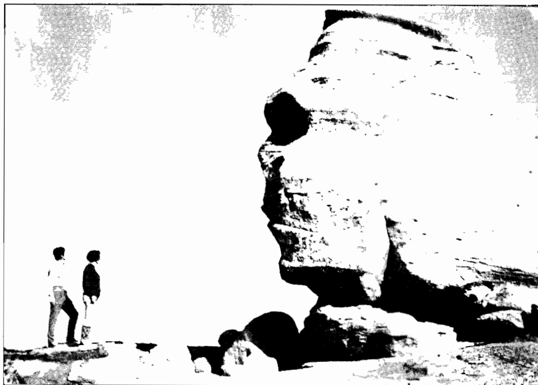
Imagine din Munții Bucegi