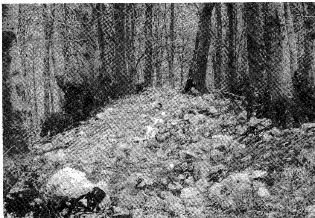
Valul de apărare de pe dealul Robului, prima poziție.

Construirea acestor lucrări de genistică antică, ce se prezintă ca niște puternici parapeteți prevăzuți și cu palisade, înalți de peste 4 m. și în grosime de la 1,5-2,5 m., pare să se fi realizat prin umplerea unor schelete din lemn și pământ (emplecton), după care, prin ardere, prin procedee încă neelucidate, au devenit blocuri monolite, ca zidurile de cetate, cum dealtfel se și prezintă miezul valului.