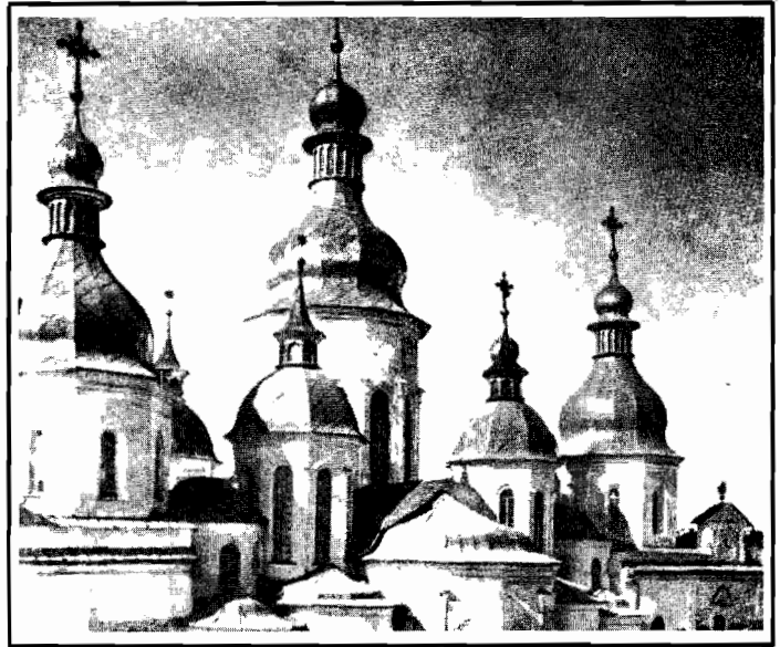
La cattedrale di S. Sofia a Kiev.

Il documento ha pure una importanza politica, dove afferma che il dialogo ecumenico favorisce la pace e può aiutare «quel processo di distensione nel campo civile che tante speranze suscita in quanti operano per la convivenza pacifica nel mondo». Una frase nella quale i vaticanisti hanno voluto ve-