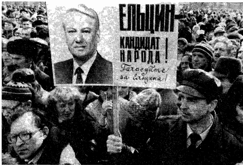
Campagna elettorale in URSS. Manifestazione di sostenitori di Eltsin, l'eretico, alfiere della Perestroika che sarà eletto a furia di popolo, spazzando via i candidati del partito.

Il ciclo delle avventure internazionali è