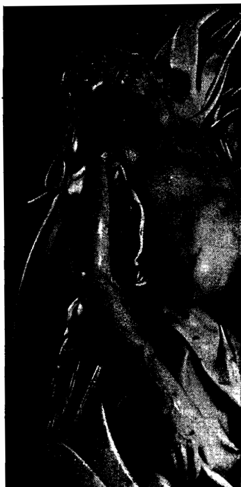
Michelangelo: "La Pietà",