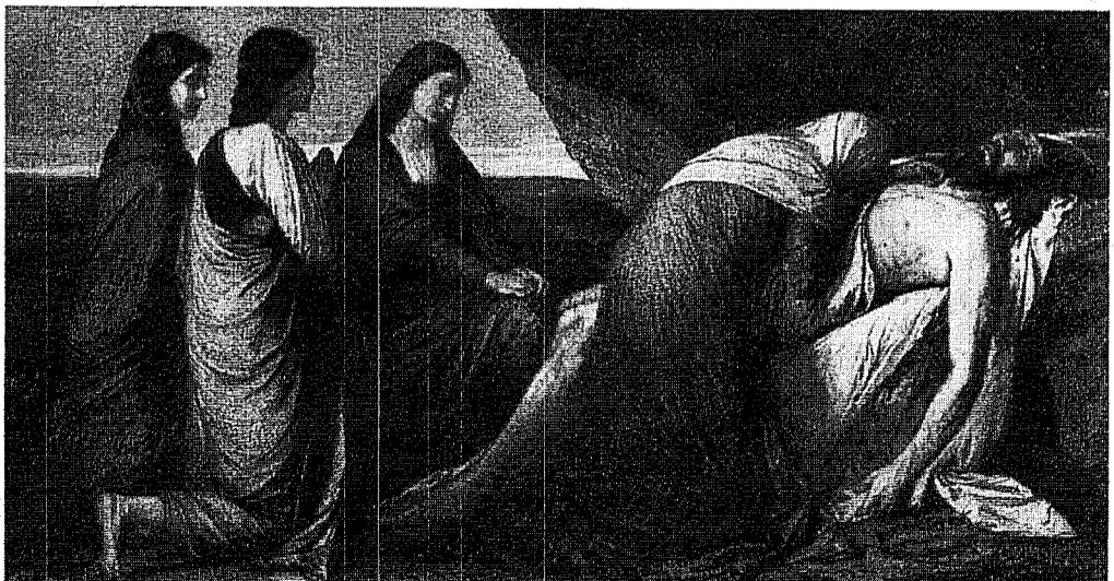
A. Tenerbach - Pienearea în mormânt

Biserica protestantă discută de asemenea asupra oportunității de a reintroduce confesiunea individuală înaintea de împărtașanie.