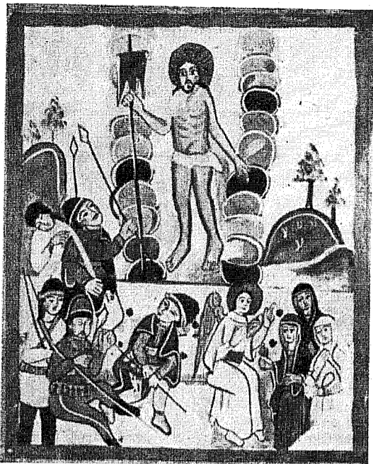
Invierea Domnului; Icoană fărașească