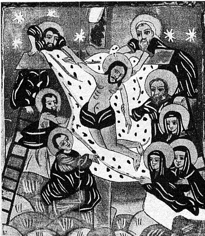
Icoană pe sticlă (de tânărul Petru Tâmas)