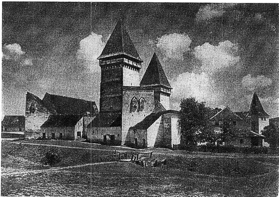
Biserică fortificată în Transilvania.