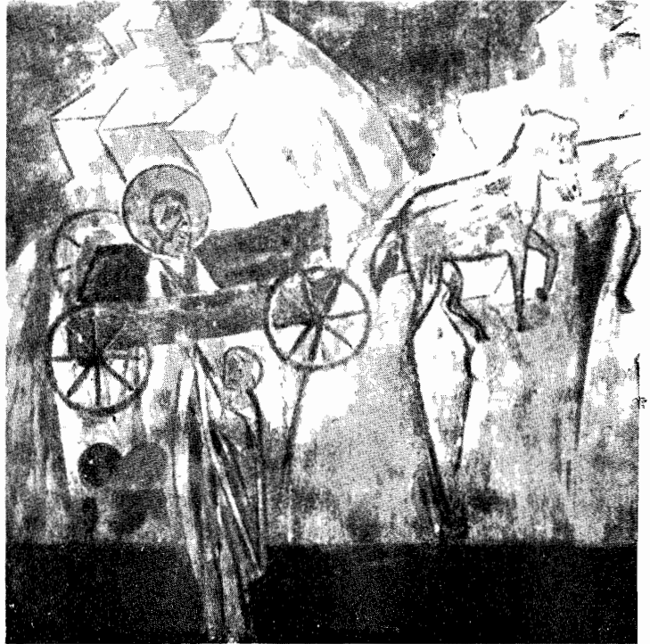
la peinture murale romaine du XV siècle