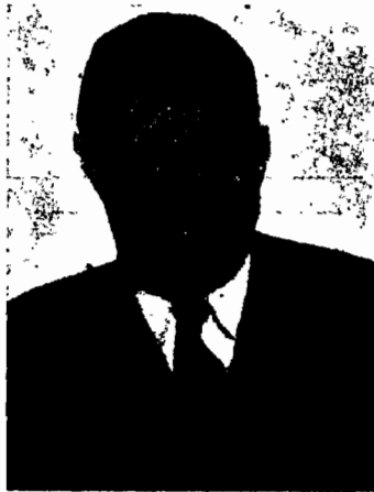
M. De Gasperi