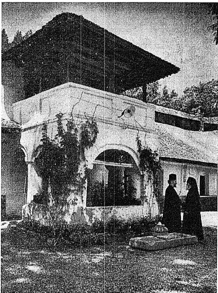
Mănăstirea Sinaia (Romania)

În sfârșit, după ce a ilustrat alte chestiuni referitoare la Conciliu, cardinalul Bea a vorbit despre extraordinara personalitate a lui Pius XII al cărui confesor a fost timp de mulți ani.