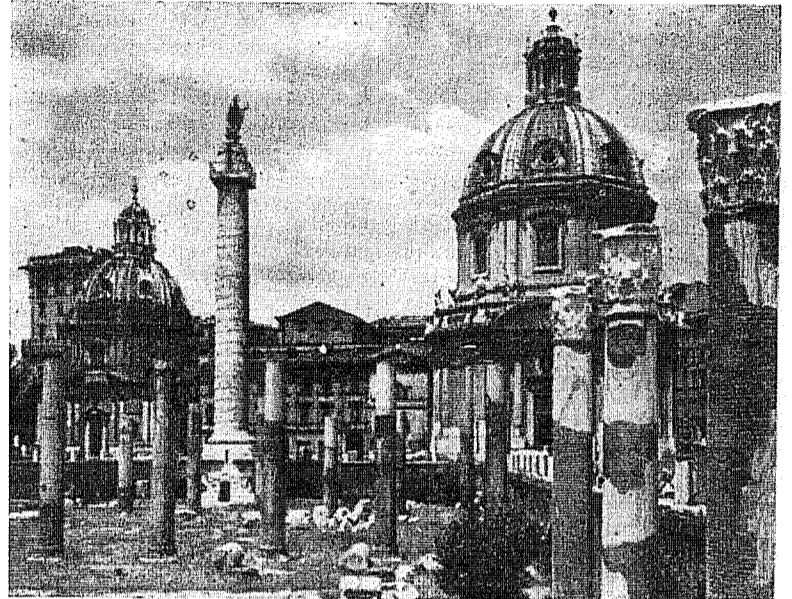
Roma - Coloana Traiană