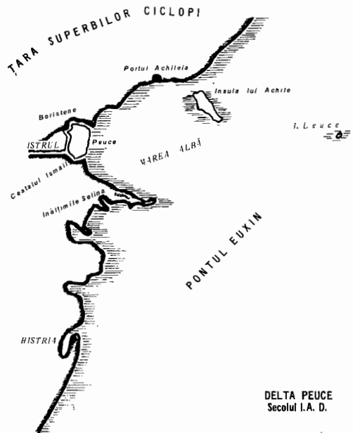
HARTA nr. 2

La început, în fața gurii Istrului, apele fluviului depuseseră și încă depuneau aluviunile transportate din interiorul Europei. Impinse neconținut înapoi de valurile mării, o parte din aluviuni au fost îngrămadite în colțul de vest al golfului, în apropiere de gura fluviului. Apoi, încetul cu încetul, aceste aluviuni au dat naștere unei insule lungi, așezată de travers pe curentul apei. În drumul lor, apele Istrului, lovindu-se de insulă, s-au bifurcat, o parte luând la început direcția nord, apoi spre est (brațul Boristene, azi Chilia), și cealaltă parte luând direcția sud-est, azi brațul Sf. Gheorghe. Și astfel acea insulă, actualul grind Chilia, a fost începutul deltei Peuce.