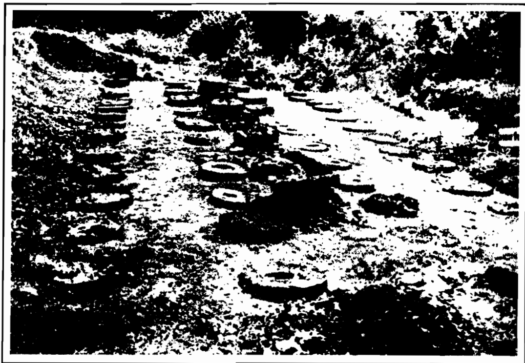
Sarmizegetusa Regia, marele sanctuar rotund.

“semne” nu le-au mai fost de ajuns și au privit iscoditori bolta cerului parcă anume desfășurată deasupra capului lor cu mișcătoare semne pentru a-i ajuta la măsurarea timpului.