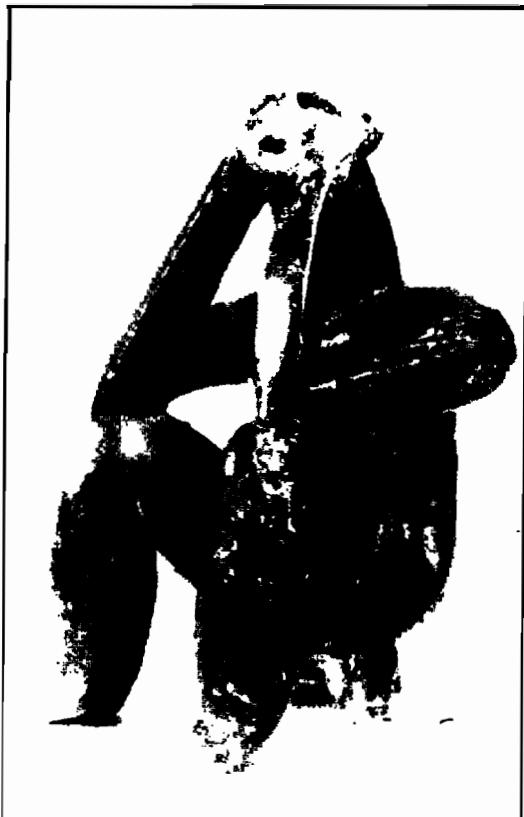
Gânditorul de la Cernavodă (cultura Hamangia).

an". Sau, că privim monumentele civilizației indiene precolumbiene, ascultându-l pe C.V. Ceran exclamând: "Fiecare edificiu maya era un calendar pietrificat; nici o îmbinare nu era întâmplătoare. Estetica era subordonată matematicii".