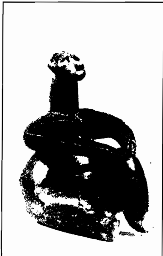
Statuetă de la Cernavodă (cultura Hamangia).