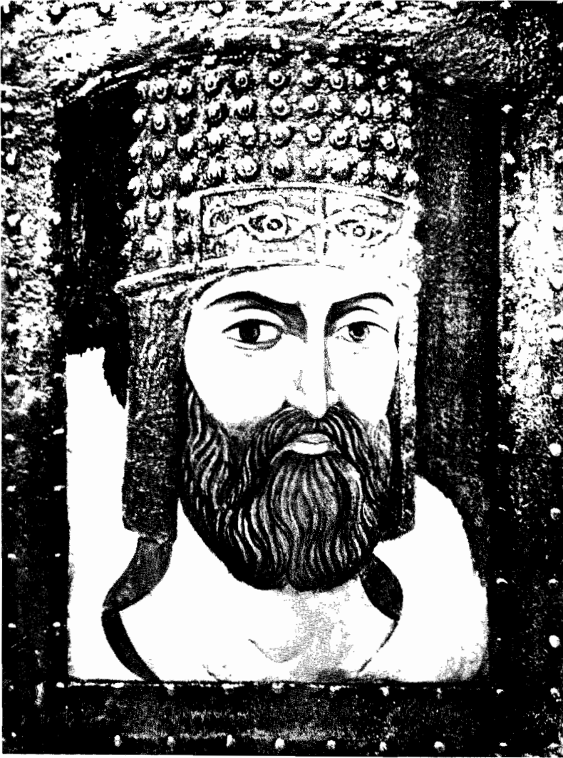
BUREBISTA - roi de Dacie (82-44 av. J.C.)

Les ancêtres des Roumains - les Daces - appartenaient à la grande famille indo-européenne des Thraces, les plus anciens habitants du Sud-Est de l'Europe. Burebista, sous la conduite duquel les Daces s'unissent pour former un grand Etat, était considéré dans une inscription de l'époque comme «le premier et le plus grand des rois de Thrace, maître de toutes les contrées au-delà et en-deçà du Danube», donc des côtes de la mer Noire jusqu'en Bohême. César lui-même, pensant que la force de Burebista devenait dangereuse pour les Romains, rassembla les troupes pour lancer une expédition en Dacie; mais la disparition des deux chefs, en l'an 44 av. J.C., fit tomber le projet de la campagne romaine.