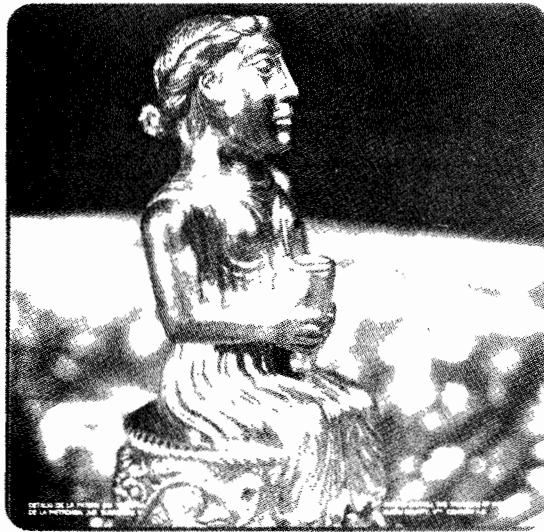
Detaliu de la patera din tezaurul de la Pietroasa, județul Buzău, sec. V. Patera (detail). The treasure of Pietroasa, Buzau Country, V-th Centuri.

Mensile. Spedizione abb. postale Gruppo III 70% - 00187 Roma, Foro Traiano 1/A, Tel.(06)679.77.85