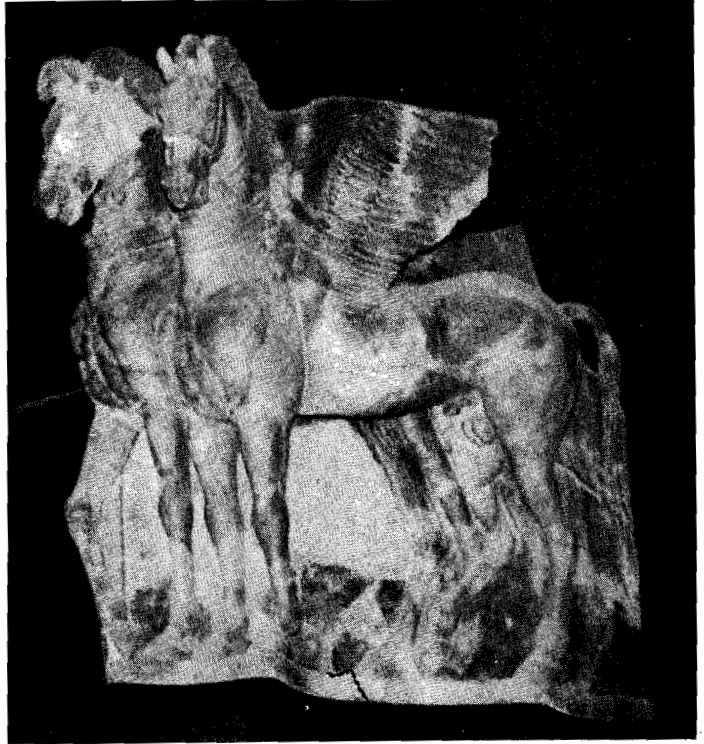
I cavalli alati di Tarquinia.

Alla fine del V Secolo a.C. i Persiani saccheggiarono la Lidia e fra il III e il II Secolo, Roma estendeva la sua dominazione fino alle città etrusche dell'Italia e