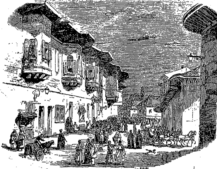
Bucureștii de altă dată (stampă din sec. XVII)

Autoritățile eclesiastice s'au pronunțat din nou asupra primejdiilor pe care le ascund o colaborare cu comunismul sau cu cei care lucrează pentru comunism și socialism. Catolicii nu trebuie să uite că socialismul, ca și comunismul, sunt ateii și deci dușmani ai religiei. Într'o scrisoare iscălită de cardinalul Ernesto Ruffini și de Episcopii și Arhiepiscopii din întreaga Sicilie adresată clerului și laicului catolic, episcopatul sicilian reafirmă necesitatea de a nu se da credit nici unei tendințe care ar putea să inducă, direct sau indirect, la o colaborare cu comunismul sau cu aliatul său, socialismul, și avertizează că una din marile primejdii ale momentului actual este constituită de acel limbaj echivoc de care se servesc dușmanii lui Dumnezeu și ai Bisericii pentru a crea iluzii și eventual a-i înșela pe catolici.