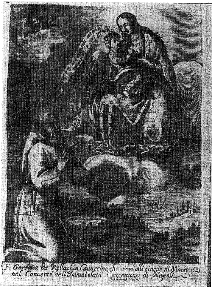
F. Geronimo da Vallachia Canucino che noni alli cinque di Marzo 1623 nel Convento dell'Immacolata Concettione di Napoli

Fericitul Ieremia Valahul - Intr'o icoană neapoletană