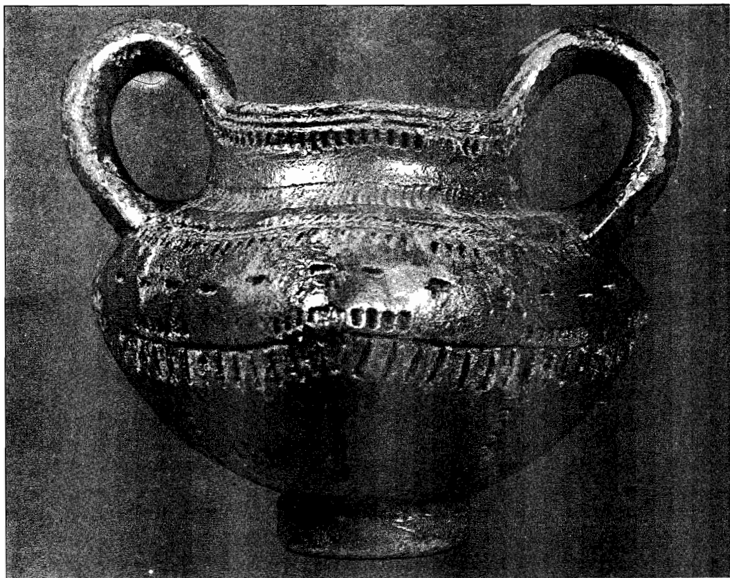
Ostrovu Mare. Cană cu două toarte cu decor caracteristic semănând cu o broderie.

Aria largă de răspândire a termenilor pastorali românești de origine dacică, precum și numărul mare de limbi în care au pătruns sunt o dovadă a expresivității și vitalității lor, a faptului că fac parte dintr-un domeniu în care Dacii și urmașii lor Români au fost și sunt neîntrepuși.