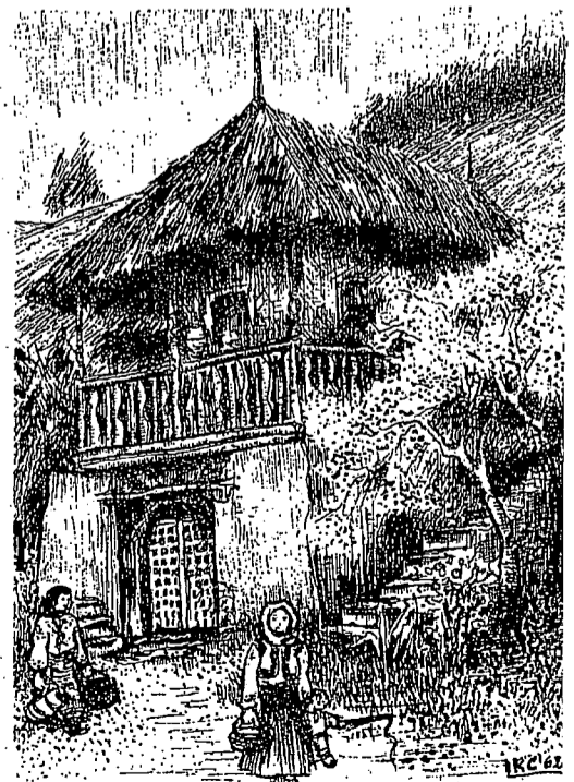
Disegno di I. Kerkoven - Constantinescu