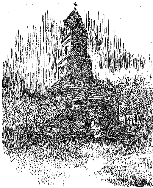
Disegno di I. Kerkoven - Constantinescu

Presentiamo ai nostri lettori un grande apostolo dell'unità cristiana: San Giovanni Crisostomo, uno dei più grandi Padri della Chiesa d'Oriente, fedele a Roma e assertore del Primato papale.