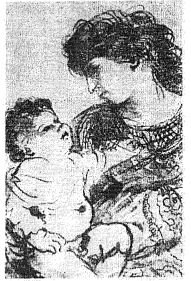
desen de Guercino - 1591 - 1666

Dacă va fi convocat, Conciliul protestant va trebui să înfrunte multe piedici. Va creia tensiuni și va da loc la multe conflicte, dar dacă vom fi dispuși să înfruntăm împreună aceste greutăți de prevăzut, Biserica va renaște, pentru a-și împlini misiunea ».