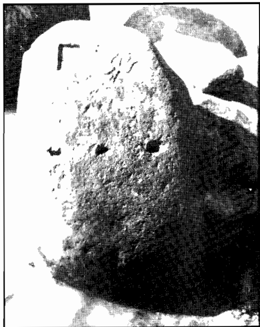
Hieroglife pe piatră tombală

Comparând crinul de pe menhir cu crinul deșertului 21 , folosit în simbolistica gândirii indo-europene, semnalăm că sunt omotetice. Mallarme a recunoscut inițierea sa în orfism 22 . O strofă din «Toată funebru» a fost folosită în travaliul hermeneutic. «Cu ochi adânc Maestru, a liniștit divin/ A raiului minune cu frământări caduce/ Al cărui freamăt ultim, în vocea lui reduce/ La crin și roză, taina acestui nume doar/ Nimic nu lasă în urmă acest destin fugar». Înlocuind termenul Mestru cu Zalmoxis și Roza cu tetractysul, obținem, imaginea și sensul primar al hieroglifelor de pe menhir, înțelegând mai ușor coincidența dintre octoedre-