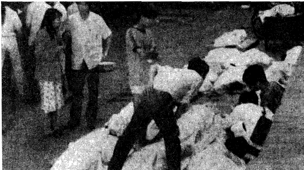
Dopo la strage si ricercano i corpi di parenti e conoscenti.

Che cosa ci racconteranno, domani, gli assassini della Città Proibita? Le solite cose, supponiamo. Diranno al mondo che i martiri di Tienanmen erano provocatori assoldati da potenze nemiche, revanscisti della «banda dei Quattro», fascisti, putridume, uova marce che era necessario schiacciare. E molti, forse, faranno finta di crederci, per amore delle joint-venture, oppu-