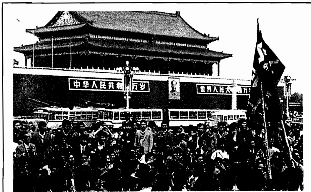
Giovani manifestanti sulla piazza Tienammen.

carica ed arrestato sotto l'accusa di capeggiare una cricca anti-partito. Ma gli studenti non hanno mollato. Infine il «grande saggio» Deng Xiaoping, Capo della Commissione militare centrale e il primo ministro Li Peng hanno deciso la linea dura facendo attaccare la piazza dai carri armati per dimostrare che il potere comunista non si mette in discussione. Secondo alcune fonti sono stati migliaia i giovani finiti sotto le pallottole dei mitra e i cingoli dei carri armati, in una giornata che sarà a lungo ricordata come una delle più nere nella storia della Cina. Orrore, sdegno e condanna in tutto il mondo civile. Dalla Russia della perestroika sono giunte caute espressioni di giustificazione per la strage dei giovani definiti teppisti.