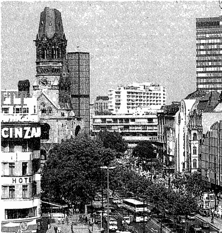
Berlino: Gedächtniskirche e Kurfürstendamm.

Il trionfo dei vincitori restava, tuttavia modesto, secondo le precauzioni che gli oratori «pro-Berlino» avevano preso per evitare di umiliare la «piccola cittadina sulle rive del Reno» di cui nessuno contesta i meriti, accumulati nel corso di quattro decenni di buoni e leali servizi come «capitale prov-