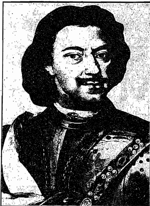
Pietro il Grande, fondatore nel 1703 di San Pietroburgo.

Nella seconda metà dell'Ottocento, San Pietroburgo assorbì le grandi novità della rivoluzione industriale. Nel 1851 venne inaugurata la linea ferroviaria con Mosca e le periferie della capitale cominciarono a riempirsi di fabbriche. Tra la fine dell'Ottocento e gli inizi del Novecento, l'impero zarista, nonostante i suoi squilibri, si inoltrò decisamente sulla via dello sviluppo, tanto che nel 1914 esso era al quarto posto nel mondo per la produzione di acciaio. Proprio la presenza dei sobborghi industriali, sempre più popolati da un proletariato giunto dalle campagne, determinò quel fermento che avrebbe consentito alla rivoluzione di esplodere.