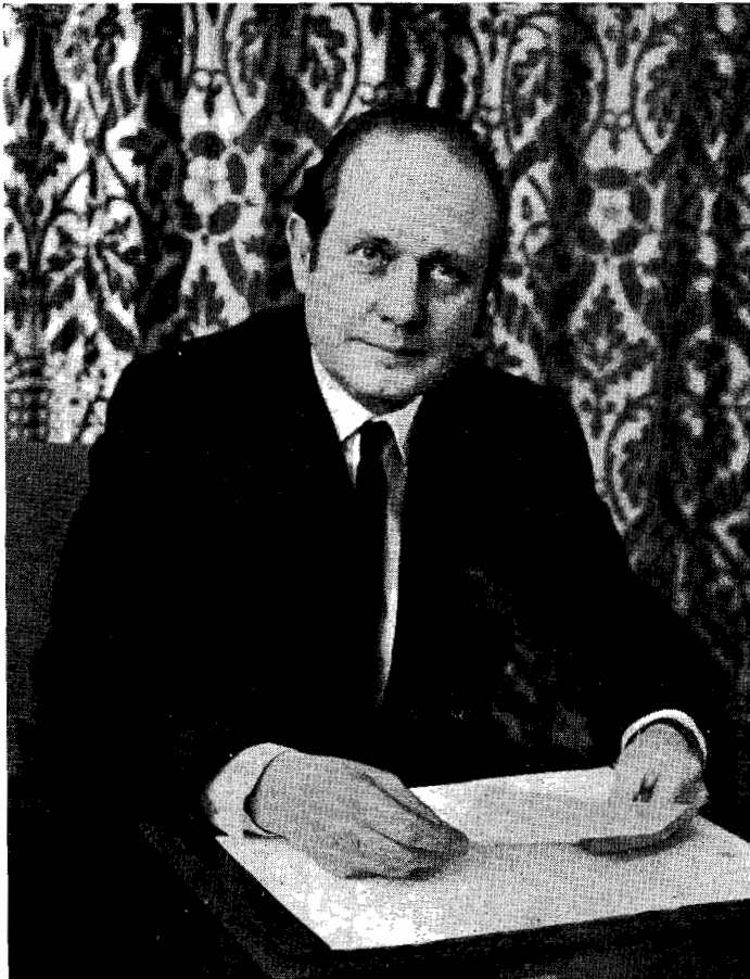
M. John Biggs - Davison