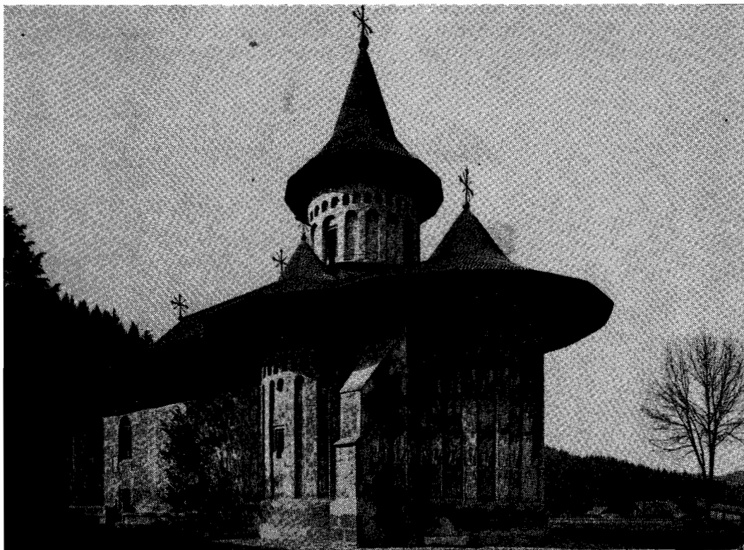
Mănăstirea Voroneț - încadrare în zonă

Tradiția bizantină se remarcă, în afară de stil și tratare, prin aceea că pictura murală se prezintă ca un ansamblu unitar, iar concepția generală a registrelor este ordonată și rezervată reprezentărilor legate de ideea ascensiunii spirituale de la concret la abstract, a înălțării (1).