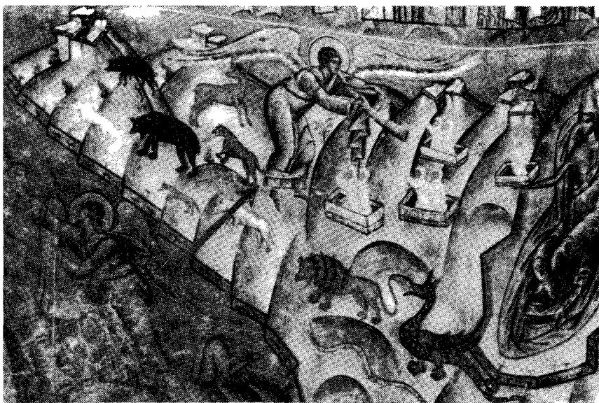
Voroneț. La judecata de apoi îngerii sună din buciume, nu din trâmbițe

Prima întrebare ce ne-o punem cu privire la tratarea picturii murale voronețiene este tocmai aceea care se referă la problema libertății artistului de a ieși din canoanele bisericești, precum și limitele acestei licențe. Nu doar din simple incursiuni în cotidian, cum ar fi, de exemplu, reprezentarea unui pescar cu undița pe malul unei ape curgătoare, ca la catedrala răreșeană de la Roman, ci o flagrantă încălcare a canoanelor (2), cum este cazul cu sacralizarea sihastrului Daniil, legendarul duhovnic al lui Ștefan cel Mare, prin acordarea însemnelor la care avea dreptul doar sfinții recunoscuți de către Biserică (3). Dar șirul de țărani-ostași ce asigurau forța și prestigiul statului moldovean, redat drept soborul Sfinților apostoli? Dar spiritul pitoresc al povestirilor populare introdus în ilustrarea vieții Sfântului Ioan cel Nou? Dar numeroasele figuri curat țărănești redat în reprezentările sinaxarului? Dar prezentarea plugului sătenilor moldoveni cu care ară Adam? dar preluările