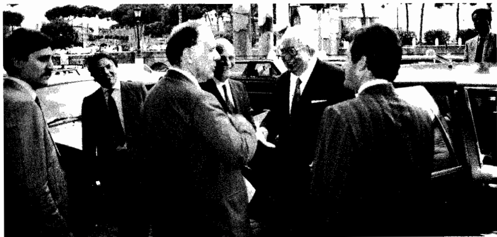
Il Presidente del Senato Spadolini al suo arrivo alla sede della Fondazione Dragan.

La scelta europea è destinata nei prossimi anni a misurarsi con dei fatti che non sono ancora nella nostra previsione o capacità di determinazione. Per esempio la crisi polacca: appare chiaro che è insolubile, del tutto insolubile se non sarà un intervento economico europeo, una specie di piano Marshall europeo. Che vada incontro alle condizioni disastrose di un'economia che il