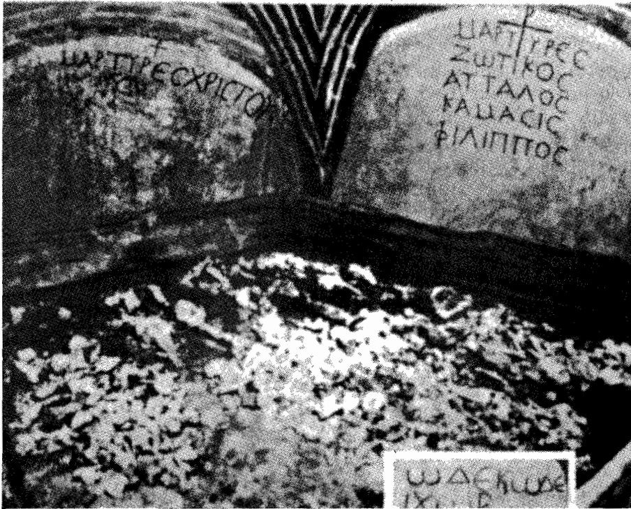
Martirionul de la Niculițel-Tulcea, cu moaștele și numele martirilor Zotikos, Attalos, Kamasis și Filippos din sec. IV-V.

Doamne» (nr. 59), toți termeni sau formule potrivite pentru situația celor repauzați. Sunt dese inscripțiile cu textul «Maria naște pe Hristos» (nr. 139,1; 140,1; 141,1; 142,1; 143,1; 144,1 etc.) sau care vorbesc despre Maica Domnului (nr. 74; 228,2-3; 263,1 etc.). Textele mariologice datează după sinoadele de la Efes (431) și Calcedon (451). Cum era firesc, inscripțiile semnaleză credința puternică în înviere (92; 94; 95; 97); cei vii sunt obligați să îngrijească mormintele celor decedați, căci vor veni și ei acolo (nr. 208); prin moartea lui Iisus Hristos se obține învierea (nr. 94; 173); crucea Lui e «crucea morții și a învierii» (nr. 173); «am murit întru nădejdea învierii și a gustării vieții veșnice» (nr. 92). În unele inscripții de tranziție de la păgânism la creștinism se vorbește de «Câmpiile Elizee» ca loc fericit pentru sufletele dreptilor (nr. 21), sau că după moarte sufletul se urcă la cer și se preface într-o stea (nr. 221). Biserica este «sfântă» și «universală» (nr. 45,2-6; 11 a), ecou al simbolului de credință niceo-constantinopolitan (325, 381), ea cinstește îndeosebi pe Sfinții Apostoli Ioan, Petru și Pavel, are martiri ca Zotikos, Attalos, Kamasis și Philippos (nr. 267) la Niculițel, apoi la Tomis, Axiopolis etc., este slujită de episcopi, preoți, diaconi, citeți și ipodiaconi, administratori, catehumeni, neofiți, împreună slujitori credincioși. 5