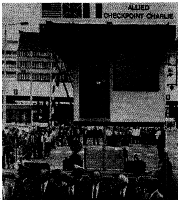
Berlino, 22 giugno - Il Checkpoint Charlie, punto di passaggio tra zona Est e zona Ovest, viene rimosso. Forse finirà in un museo.